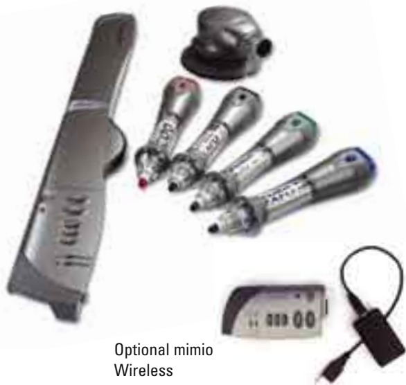
Optional mimio Wireless